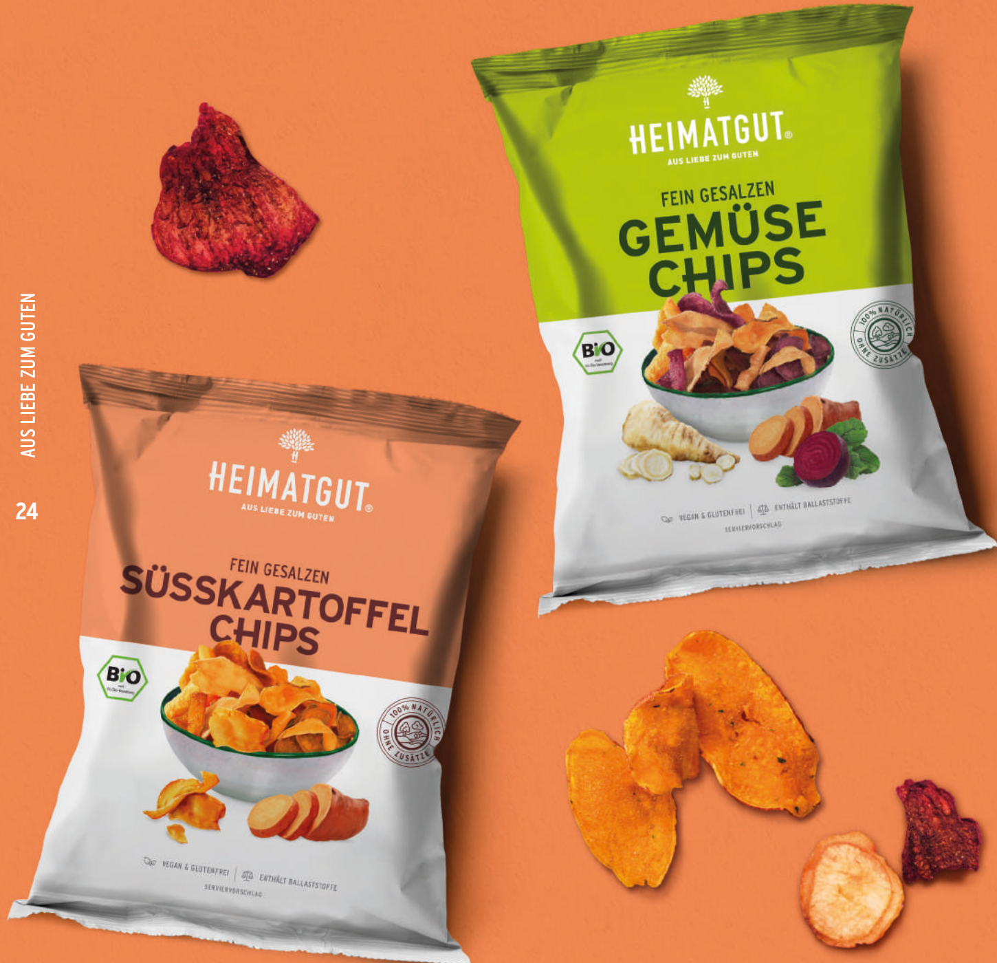
Bio Gemüse Chips 100 g Bio Süßkartoffel Chips 100 g