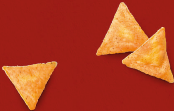
Bio Tortilla Chips Sweet Chili 125 g Bio Tortilla Chips Meersalz 125 g